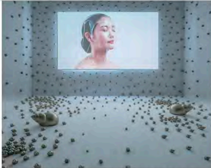
Chulayarnnon Siriphol, Golden Spiral , 2018, painted snail shells, HD video projection (color, sound, 18 minutes). Installation view.

All Cities Basel Berkeley Berlin Buenos Aires Doha Düsseldorf Guangzhou Ho Chi Minh City Istanbul London Los Angeles Madrid Mexico City Miami Milan Moscow New Delhi New York Oakville Oxford Paris Rio de Janeiro Rome Shanghai Stockholm Washington, DC Yogyakarta