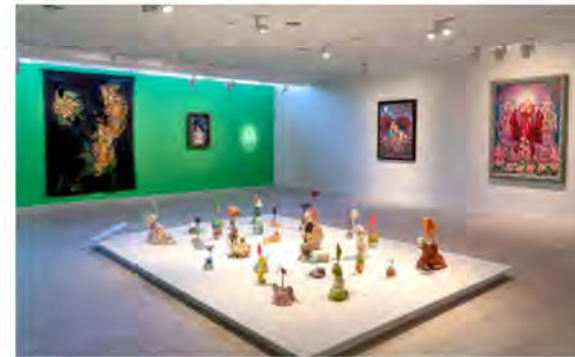
Zevk Meselesi , Pera Müzesi yerleştirme görüntüsü, 2021. Farah Al Qasimi, Dream Soup, 2019, video yerleştirme ve parfüm, 7'26".